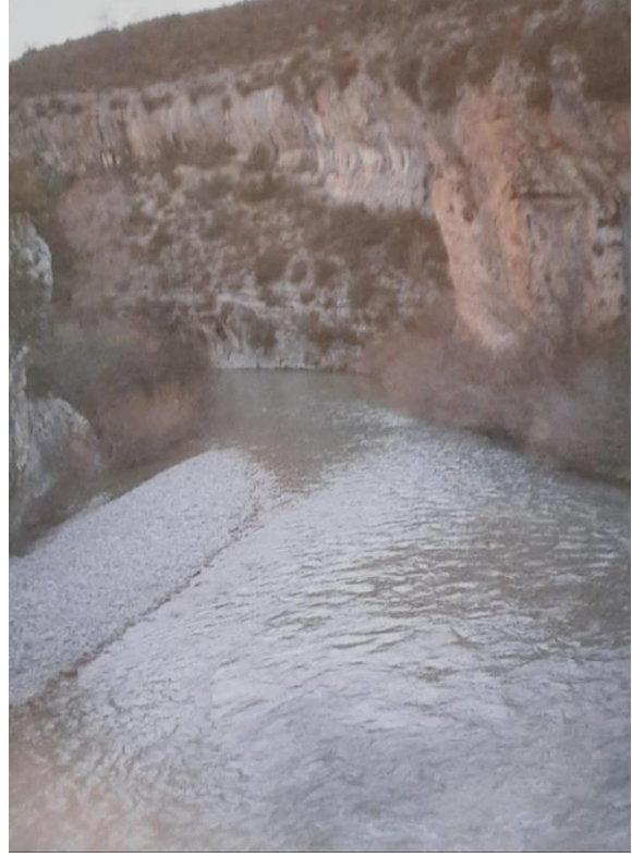
El cauce del rio antes y ahora