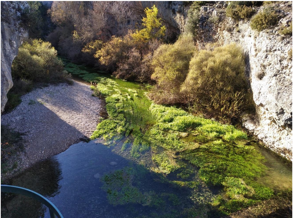
Algunas zonas son intransitables